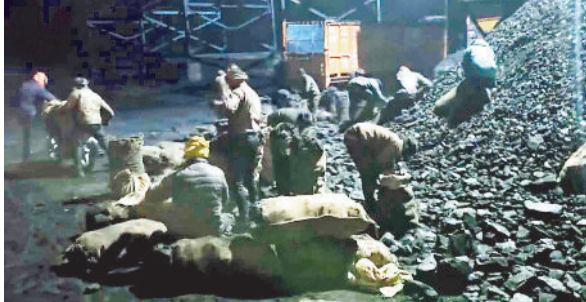
खदान से कोयला चोरी करते ग्रामीण।

इन दिनों गायत्री खदान से कोयला चोरी होने का सिलसिला थमने का नाम नहीं ले रहा। दिनदहाड़े कोयला चोरी ने प्रबंधन को नक में दम कर दिया है बल्कि सरकारी राजस्व को भी नुकसान पहुंच रहा है। हैरानी की बात तो यह है कि सुरक्षा के लिए जवानों की तैनाती के बावजूद चोरी का सिलसिला रुकने का नाम नहीं ले रहा है। सूरजपुर-सरगुजा सीमावर्ती क्षेत्र में कोयला चोरी का पूरा नेटवर्क बेहद संगठित तरीके से काम कर रहा है। खदान के अलग-अलग हिस्सों में मोटरसाइकिल और मिनी वाहनों के जरिए कोयला निकाल आसपास क्षेत्रों में खपा रहे हैं। ठंड बढ़ते ही एक बार फिर गायत्री खदान में